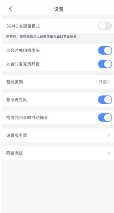
图 4-2 设置界面