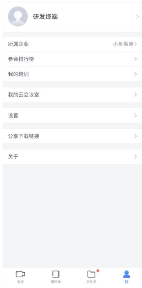
图 4-1 个人设置界面